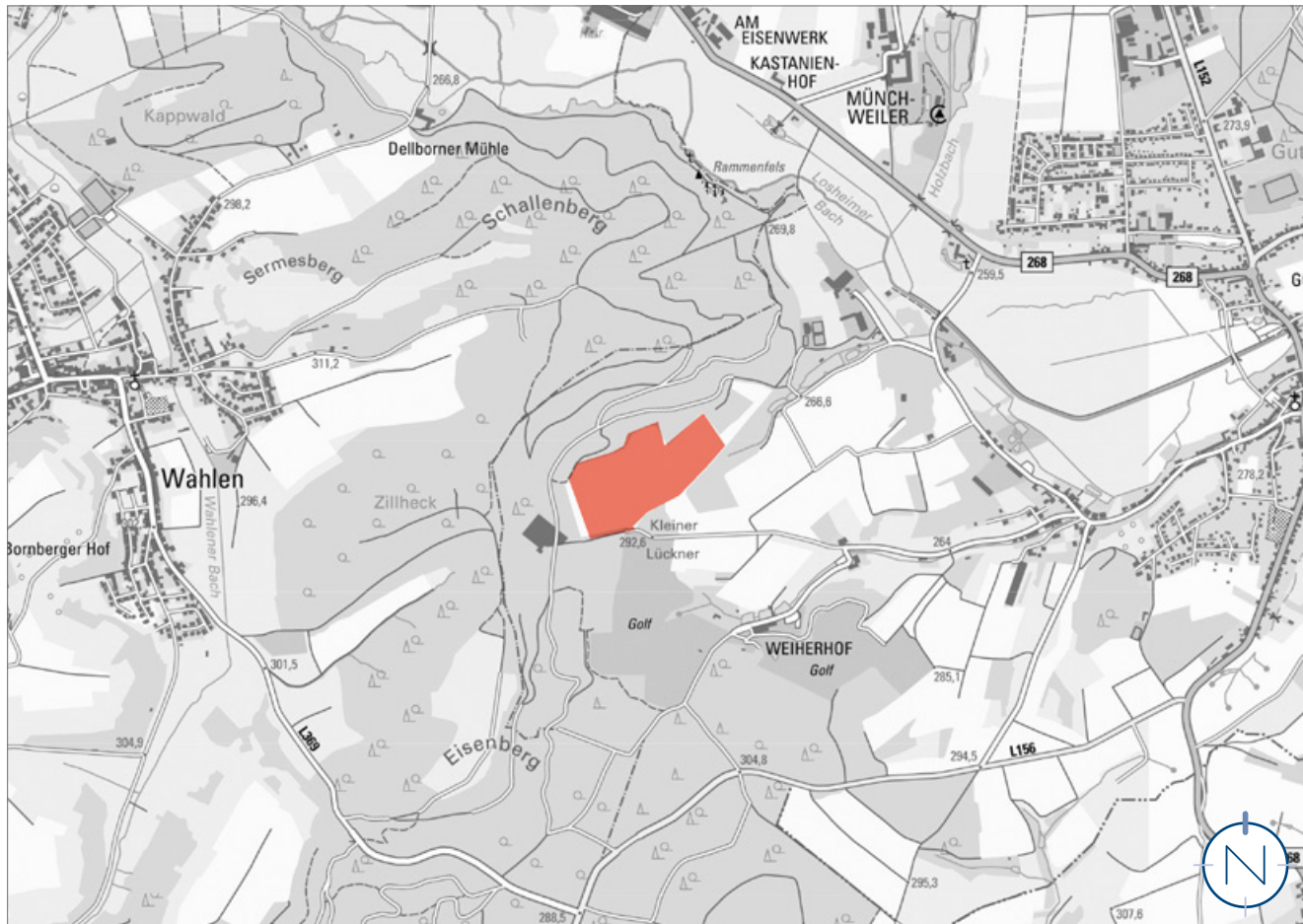
Lage des Plangebietes; ohne Maßstab; Quelle: LVGL, ZORA; Bearbeitung: Kernplan

Im Saarland dürfen bei Zuschlagsverfahren für Solaranlagen von der Bundesnetzagen-