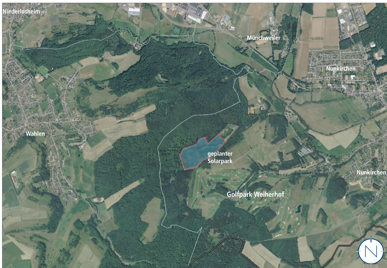
Orthophoto mit Lage des Plangebietes; ohne Maßstab; Quelle: LVGL, ZORA; Bearbeitung: Kernplan

Parallel zur Teiländerung des Flächennutzungsplanes ist eine Umweltprüfung nach § 2 Abs. 4 BauGB durchzuführen. Der Umweltbericht ist gesonderter Bestandteil der Begründung (Der Umweltbericht wird erst nach der frühzeitigen Beteiligung der Behörden gem. § 4 Abs. 1 BauGB fertiggestellt. Auf Basis der frühzeitigen Beteiligung wird zunächst der erforderliche Umfang und Detaillierungsgrad des Umweltberichts gem. § 4 Abs. 1 Satz 1 BauGB ermittelt.)