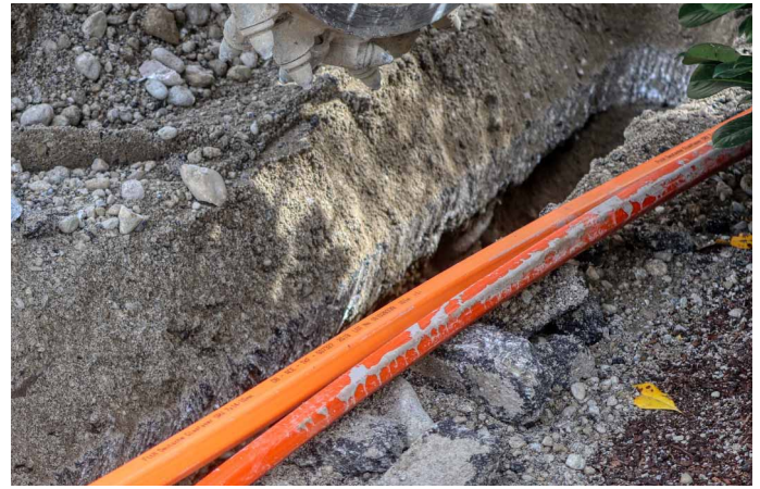
Zukunftsinvestition: Der Glasfaserausbau in der Stadt Wadern ist ein 20-Millionen-Euro-Projekt.

In Gebieten, in denen die Niederspannungsfreileitungen erneuert werden, erfolgt die Anbindung der Glasfaser über