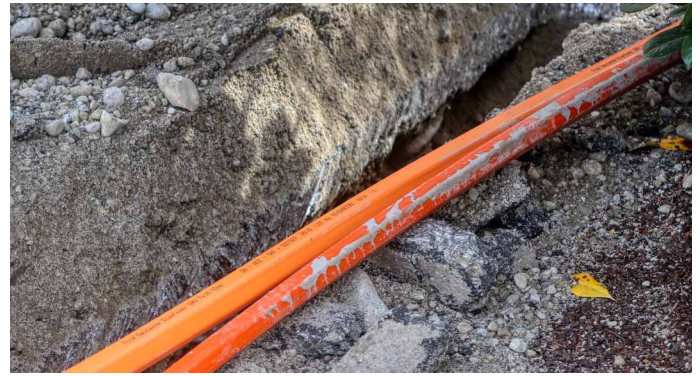
Zukunftsinvestition: Der Glasfaserausbau in der Stadt Wadern ist ein 20-Millionen-Euro-Projekt.

Alle aktuellen Informationen und Termine zum Glasfaserausbau erhalten Sie direkt auf der Website www.energis.de/wadern . Vor und während der Baumaßnahmen auf Ihrem Grundstück bespricht energis die Bautätigkeiten sowie den zeitlichen Ablauf im Detail mit Ihnen.