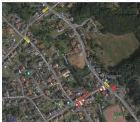
Morscholz, Konfelder Straße

Die Verkehrsteilnehmer werden gebeten, die Beschilderung zu beachten.