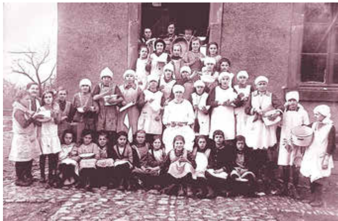
Haushaltsschule in Lockweiler, Ende der 1920er Jahre

Aktuell sucht das Stadtmuseum für seine kommende Sonderausstellung zum Thema „Schulleben im Wandel der Zeit“ noch Leihgaben von Privatpersonen.