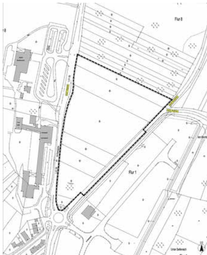
Abbildung des Geltungsbereichs des Bebauungsplans „Gewerbepark Wadern 4. BA“, ohne Maßstab, genordet.

Der Geltungsbereich des Bebauungsplans ist aus unten stehender Abbildung ersichtlich.