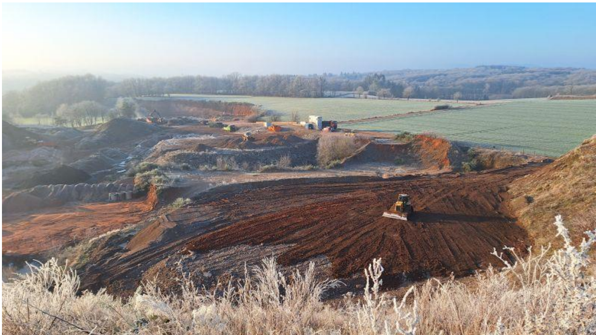
Blick von Südost nach Nordwest über die Fläche des geplanten Vorhabens im Januar 2025

Verfahrensstand: Entwurf zur öffentlichen Beteiligung