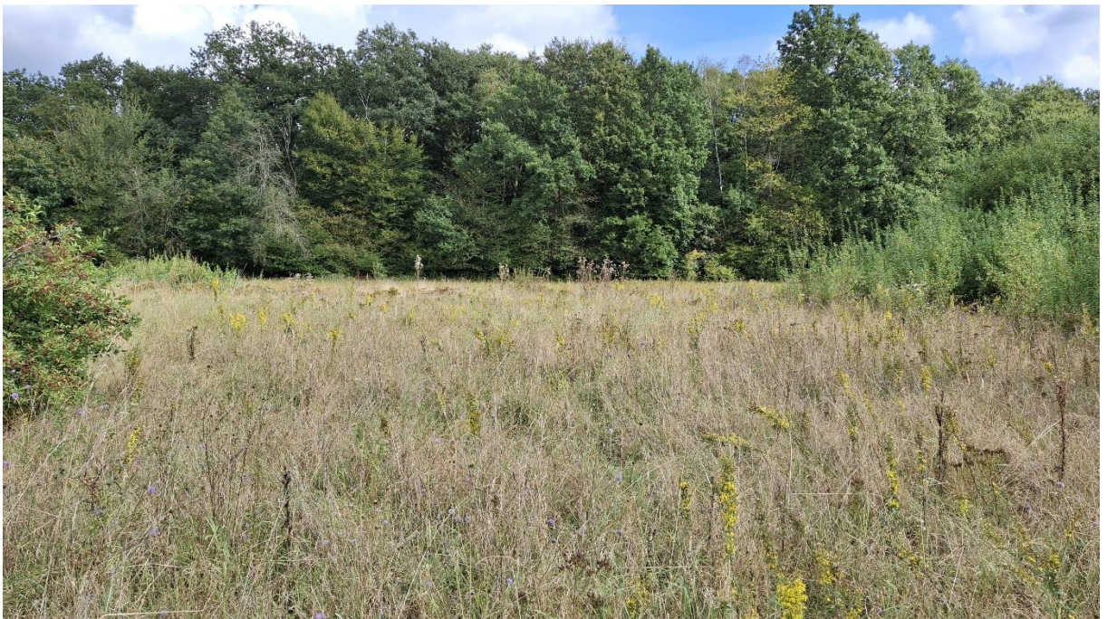
Abb. 4: Magerwiesenbrache (EE4) im Nordwesten des Plangebiets.