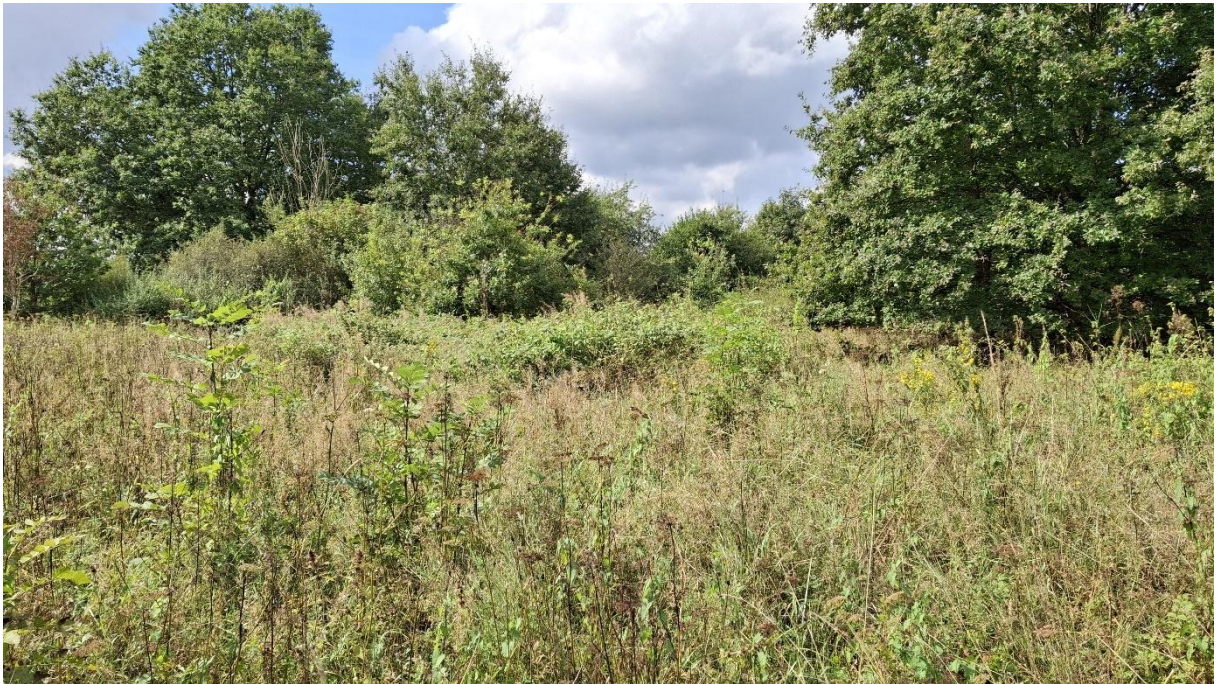
Abb. 5: Feuchter Teilbereich der Magerwiesenbrache (EE4) nahe der L149 mit zahlreichem Jungwuchs von Fraxinus excelsior . Im Hintergrund: Stiel-Eichen reiche Feldgehölze (BA1).