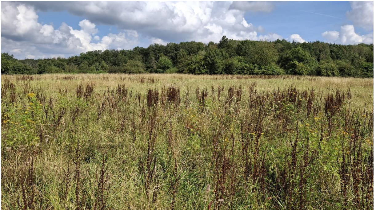
Abb. 3: Ruderale, störzeigerreiche Wiese (EA1,chf,tu) im Zentrum des Plangebiets.