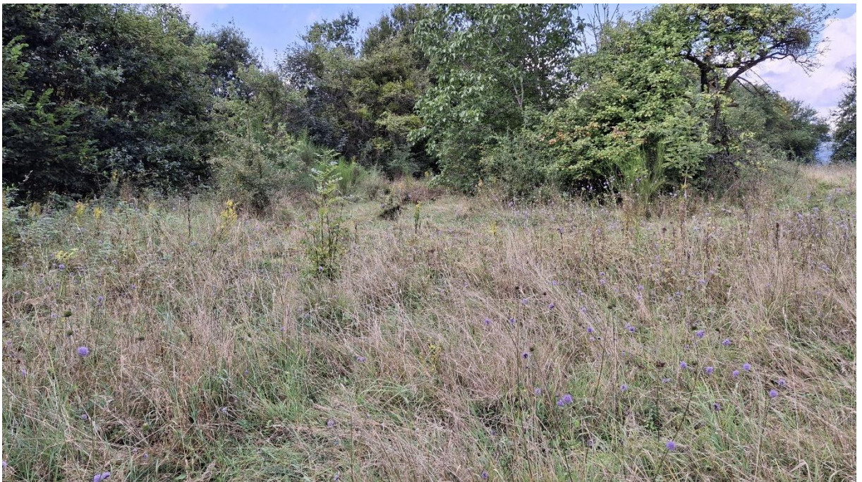
Abb. 6: Pfeifengraswiesenbrache (EC4) im Succisa pratensis -Aspekt mit Feldgehölzen im Hintergrund.