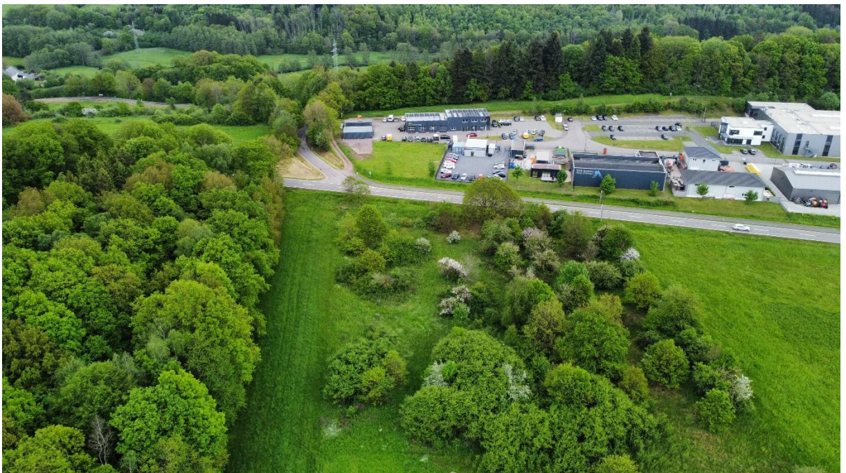
Abb. 10: Drohnenaufnahme (2023) vom nordwestlichen Teil des Plangebiets und dem angrenzenden Gewerbegebiet. Gut zu erkennen ist der hohe Verbuschungsgrad der ehemaligen Pfeifengraswiesen.