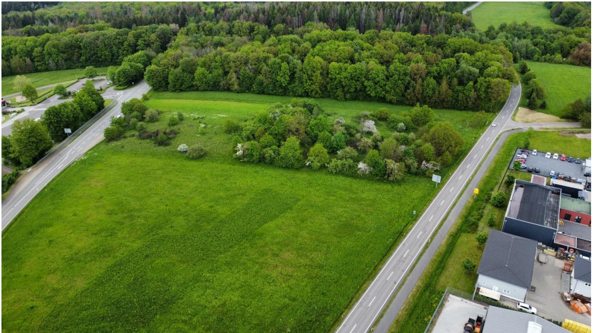
Abb. 9: Drohnenaufnahme (2023) vom nördlichen Teil des Plangebiets.