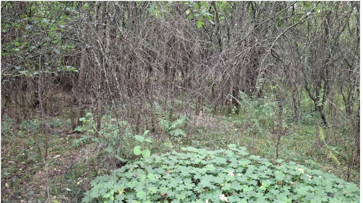
Abb. 7: Exemplarische Aufnahme aus dem Unterwuchs eines der Feldgehölze (BA1) im Plangebiet.