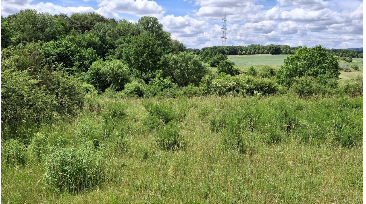
Abb. 11: Blick auf die Grünlandbrachen der externen Maßnahmenfläche.