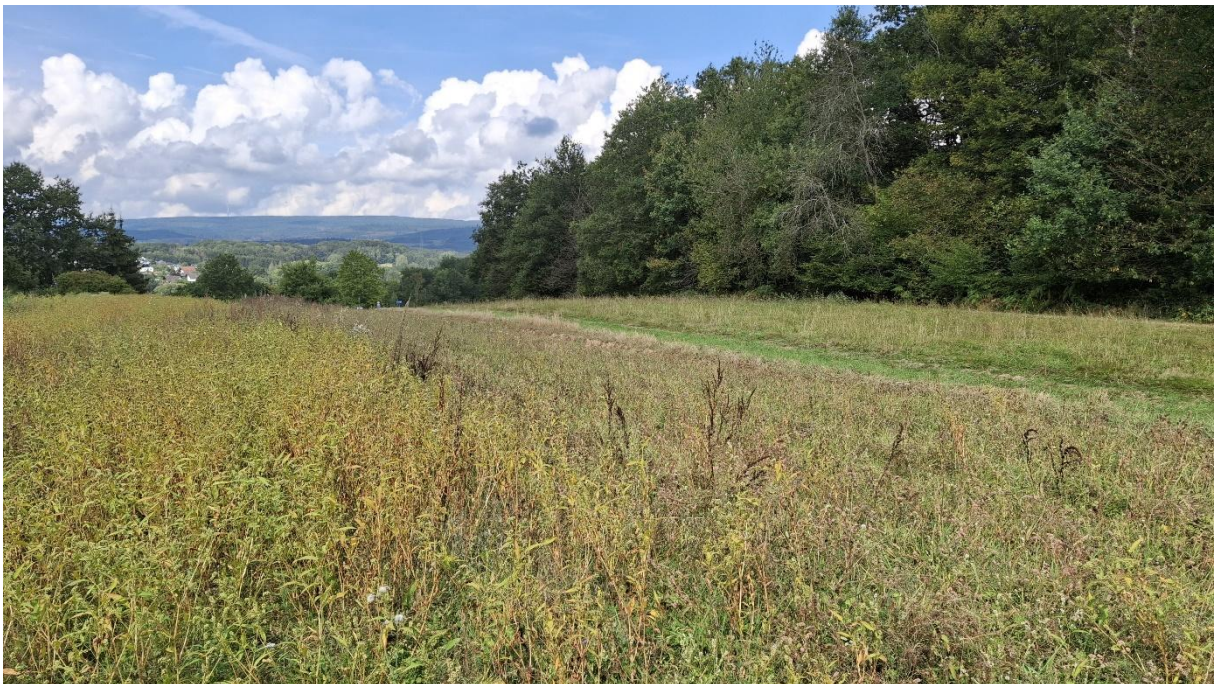
Abb. 8: Acker (HA0) und Glatthaferwiese (EA1, chg) im Nordwesten des Plangebiets.