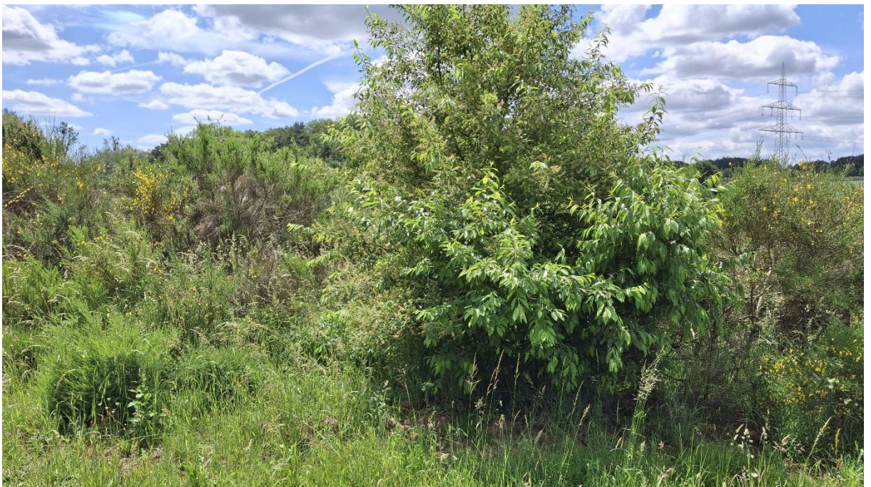
Abb. 12: Exemplarische Aufnahme der verbuschten Teile der externen Maßnahmenfläche.